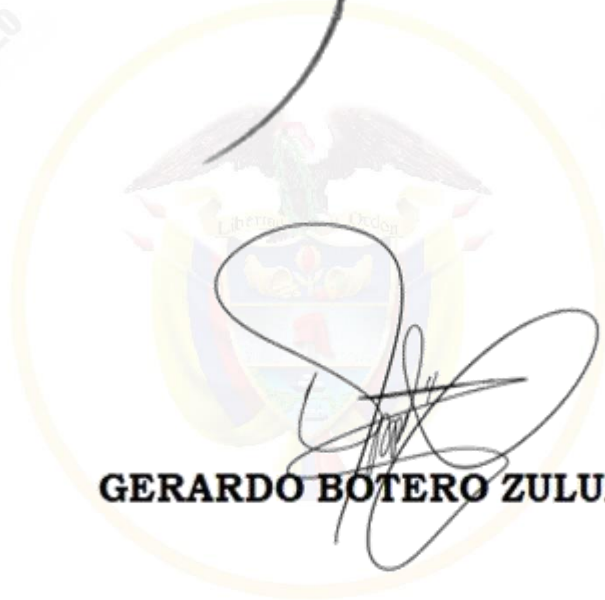
GERARDO BOTERO ZULUAGA

República de Colombia Corte Suprema de Justicia