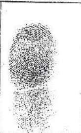
Índice derecho del entrevistado