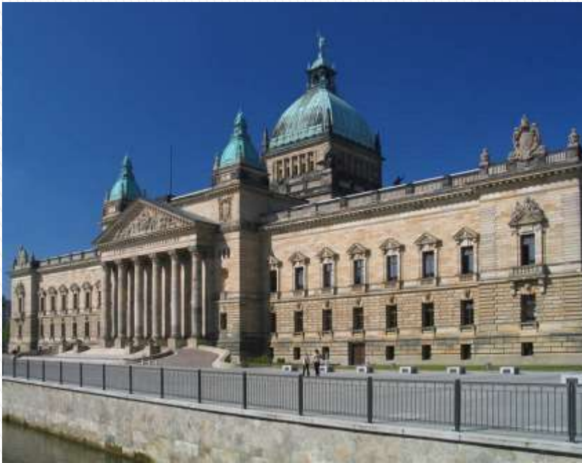
Tribunal Supremo Alemania