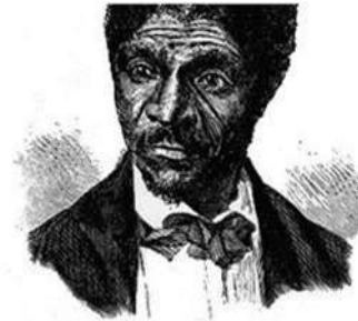
Dred Scott v. Sandford (1857)

El caso Dred Scott vs. Sandford fue invalidado por la XIII y XIV enmiendas.